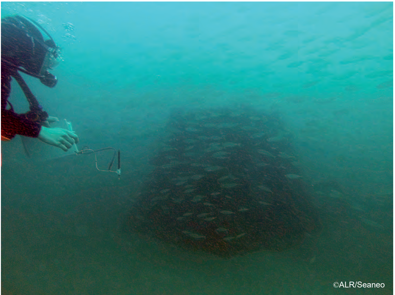
Le récif Typi immergé en 2010 entouré de bancs de poissons