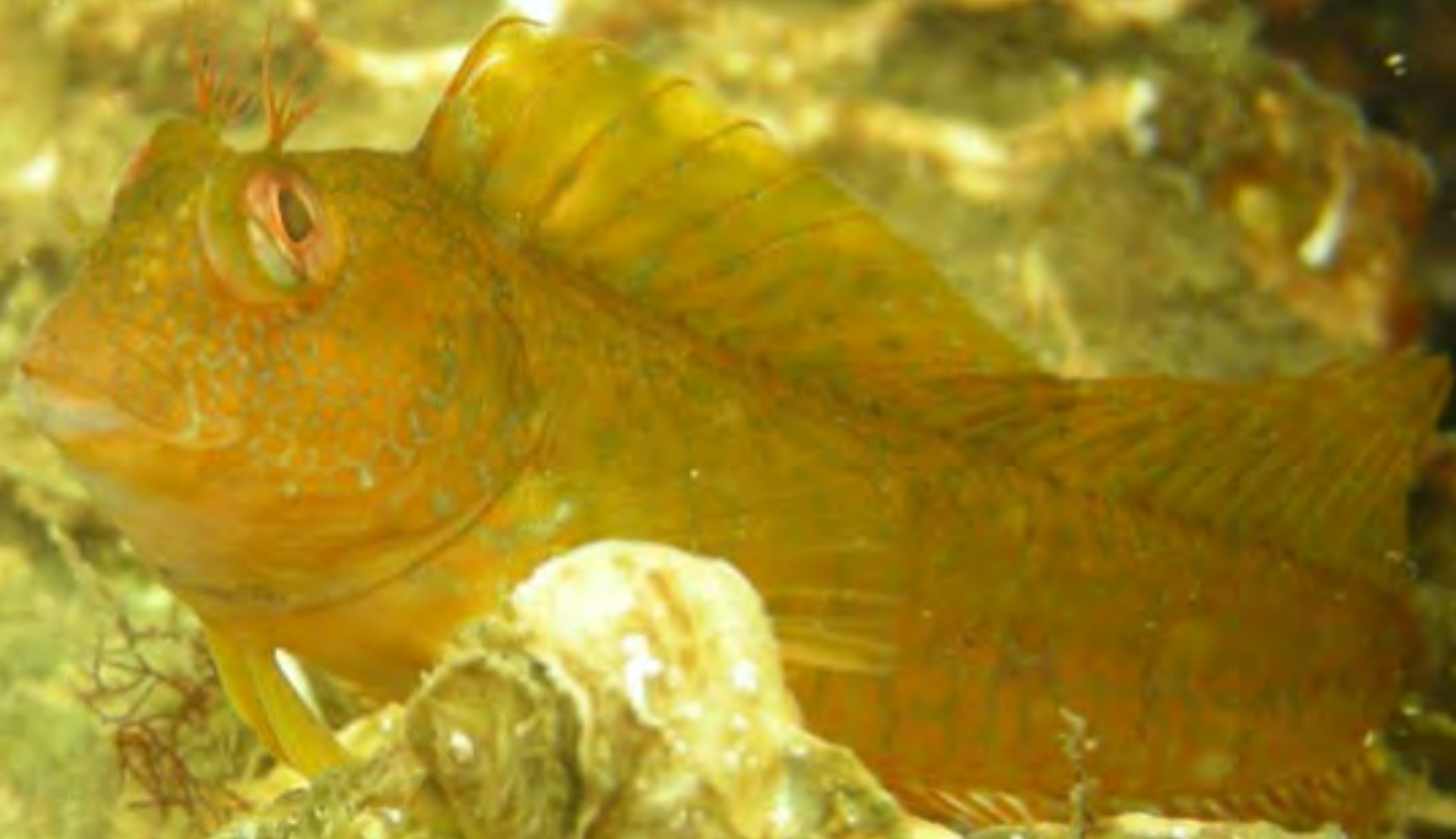
Blennie pilicorne ( Parablennius pilicornis )