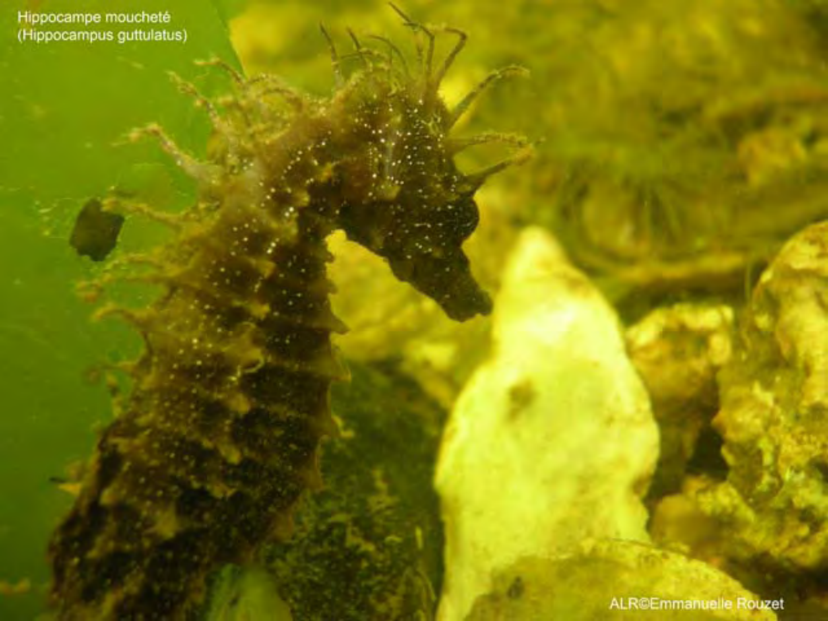
Hippocampe moucheté (Hippocampus guttulatus)