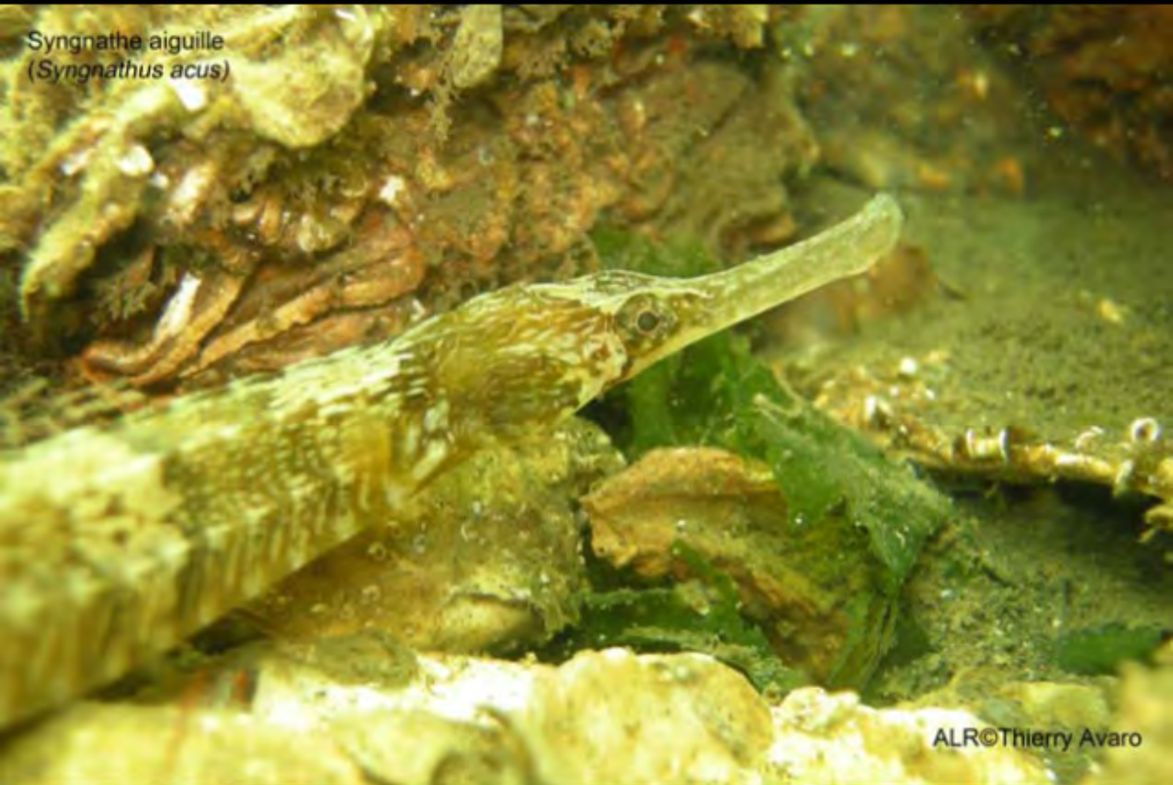
Syngnathe aiguille ( Syngnathus acus )