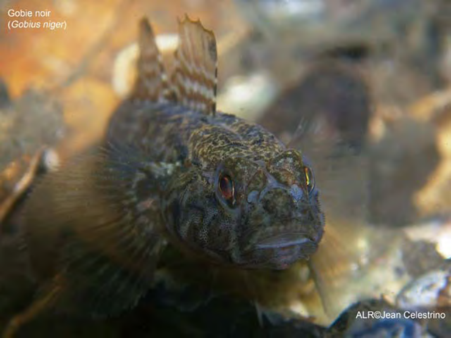
Gobie noir ( Gobius niger )