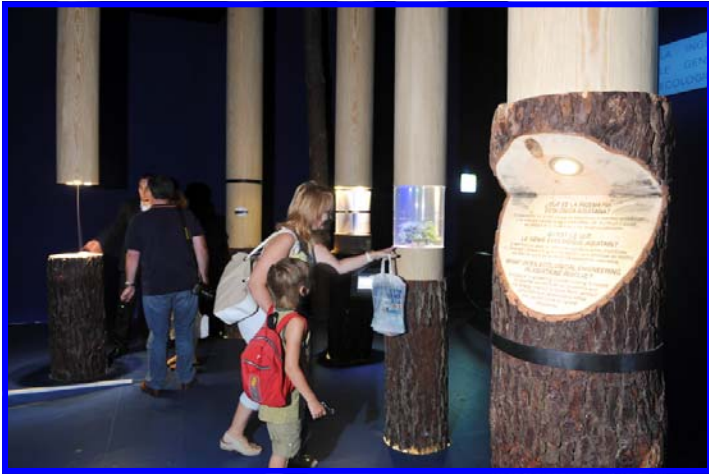
Vue d'une partie de l'exposition de la Région Aquitaine dans le village de France