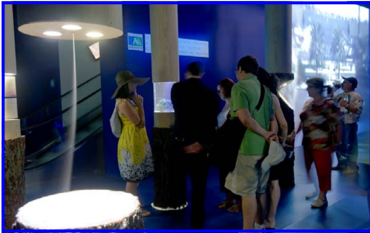
L'œuvre qui attire le plus les visiteurs, en particulier les récifs artificiels de la côte Aquitaine