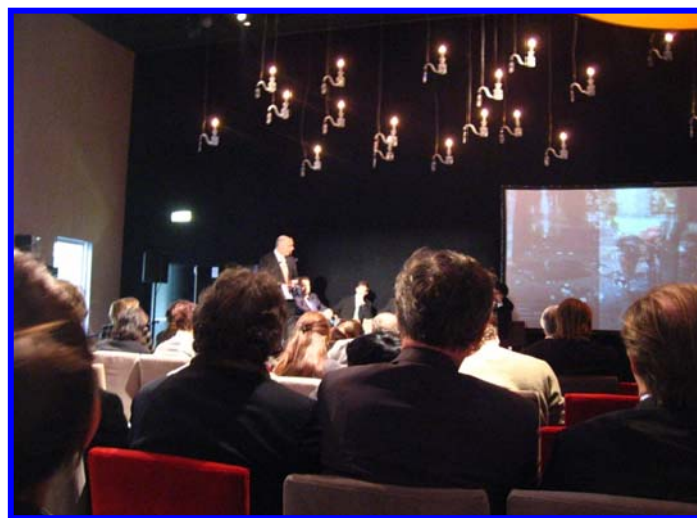
13 février 2008, le Président de la région Aquitaine Alain Rousset présente le plan du pavillon France au grand Palais

Des représentants de la Région Aquitaine sont venus s'informer sur les réalisations d'Aquitaine Landes Récifs, au siège social de l'association pour cette manifestation internationale, accompagnés des membres du groupement d'artistes Parisiens les « Chevreaux Suprématistes »