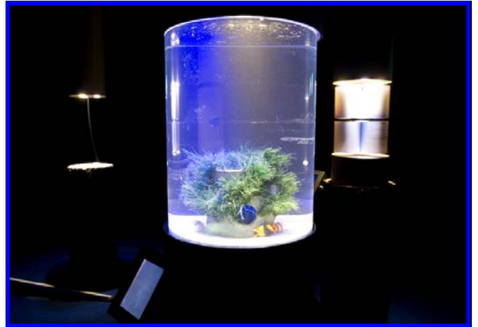
Faux poissons dans l'aquarium