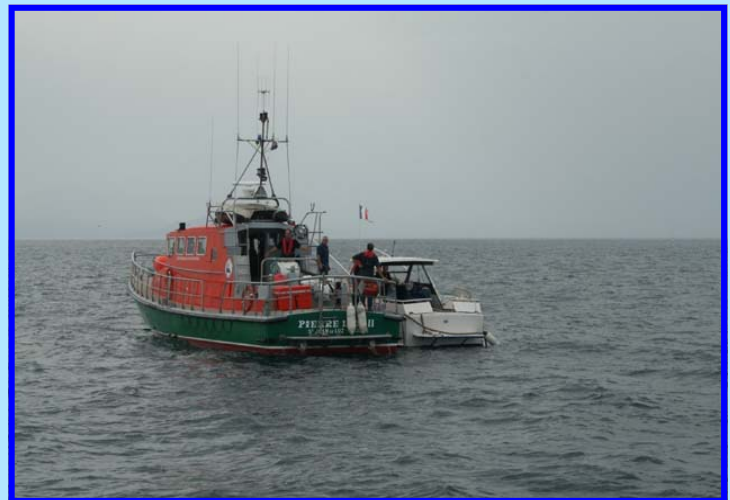
Photo prise de l'EIDER le Pierre Lotti II et le bateau secouru