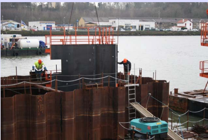
Instalação cofragem para a elevação do pilar P7