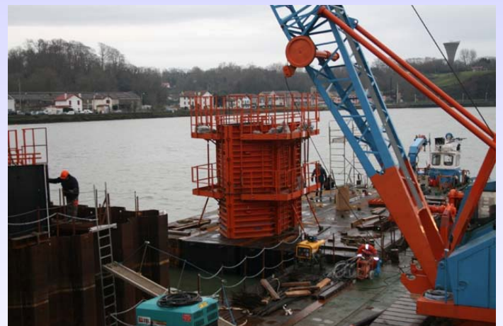
Cofragem no pontão à espera da instalação no caixão