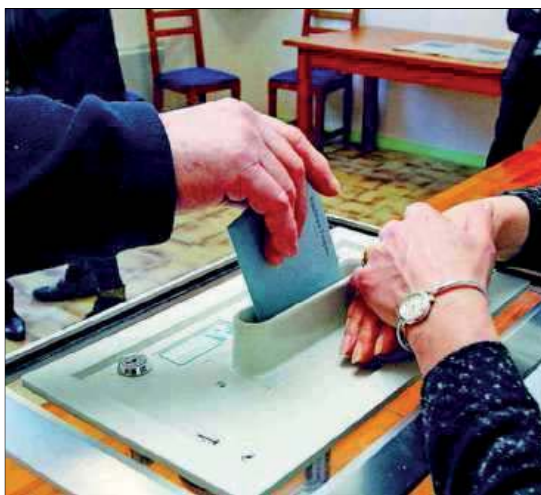
Pour la première fois, les communes de plus de 1 000 habitants élisent aussi leurs délégués communautaires.