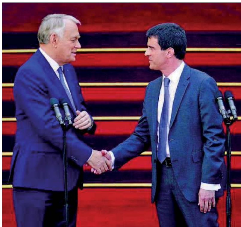
La passation des pouvoirs entre Jean-Marc Ayrault et Manuel Valls fut brève.

REMANIEMENT À peine installé et occupé à former son gouvernement, le Premier ministre doit gérer une situation tendue : Europe Écologie-Les Verts claque la porte ! Pages 2 à 4